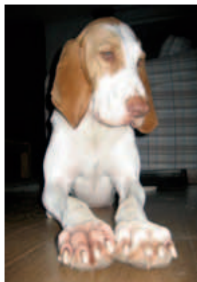
Riva met huidproblemen en roze poten