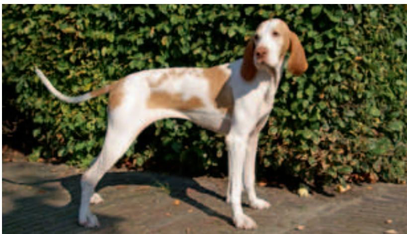
Een gezonde Riva in september 2011

oorontsteking. Olga gebruikte diverse oorreinigers, medicinale shampoo en antibiotica. In overleg met Ruth Geudens van SANIMED besloot Olga om over te stappen naar SANIMED Atopy/Sensitive. Riva knapte snel op en kreeg een glanzende vacht zonder ontstekingen. De roze poten zijn nu verdwenen en de ontlasting ziet er goed uit. Het gebruik van de shampoo en reinigers werd ook afgebouwd.